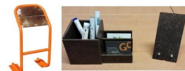
Figure 3 : Produits issus de la valorisation de mégots par M6Go 1 - à gauche : mobilier urbain; à droite : pot à crayons et support de téléphone

La transformation des filtres est possible et démarre